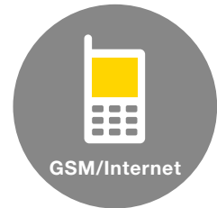
Meldungen und Steuerung